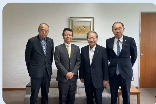
左から 野川常任幹事、上村市長、北川会長、戸川幹事長