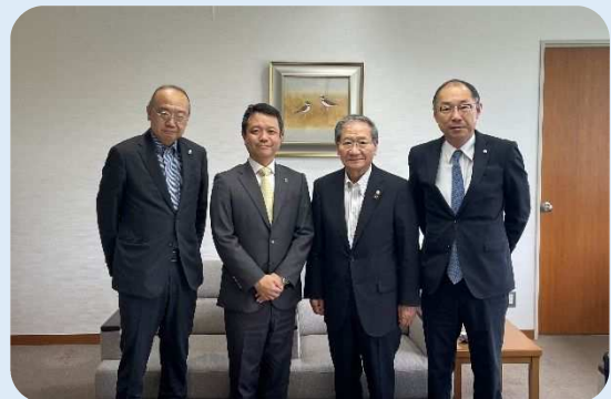
左から 野川常任幹事、上村市長、北川会長、戸川幹事長