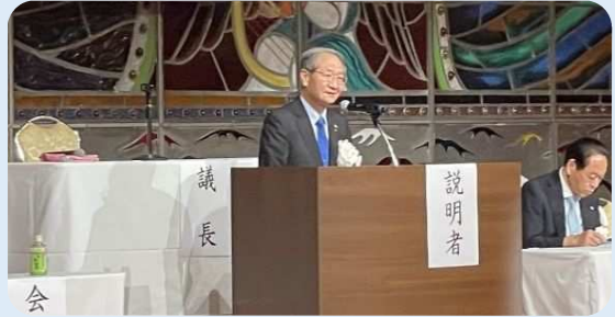
挨拶をされる北川会長