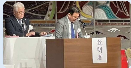
議案を説明される清水会計責任者