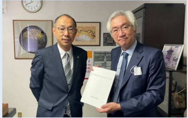
左から 戸川幹事長 西田参議院議員

今回、税制面では、「低未利用地の適切な利用・管理を促進するための特例措置の延長及び拡充」、「空き家等の発生を抑制するための特例措置の延長及び拡充」、