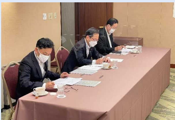
懇談会の様子（公明党）