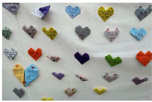
折り紙に書かれた直筆の応援メッセージ