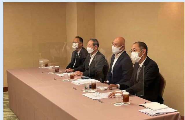
懇談会の様子（京政連・京都宅建）