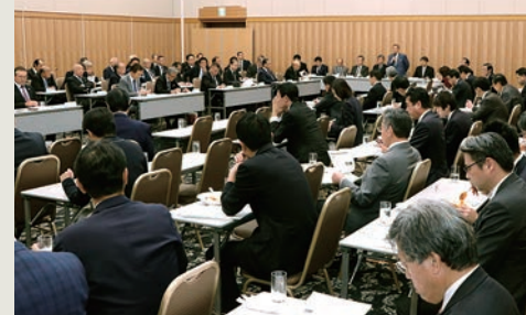
▲宅議連・全政連 合同総会でも要望（令和1年10月23日）