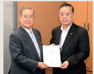
▲野田毅自民党税制調査会最高顧問・宅議連会長（左）に要望（令和1年9月9日）