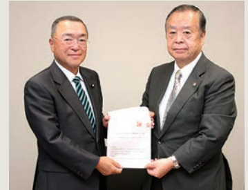
▲宮沢洋一自民党税制調査会小委員長（左）に要望（令和1年10月10日）